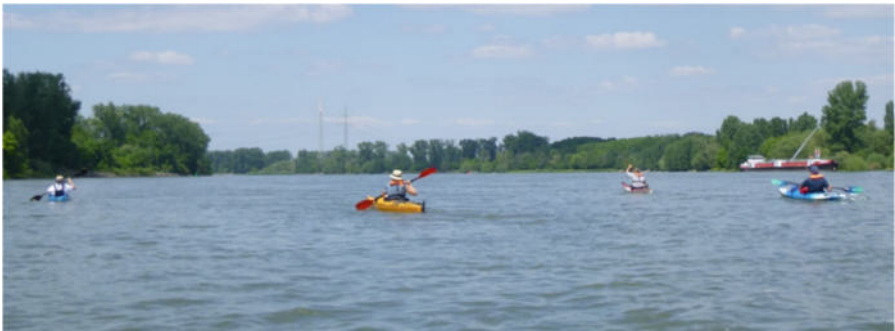
Himmelfahrtstour, kurz hinter der Petersaue

Auf der Kiesbank machten wir eine Picknick-Pause und dann ging es weiter nach Worms. Im Floßhafen hatten wir das Ziel, unsere Kanuhalle, erreicht. Bei Kaffee und Kuchen ließen wir den Paddeltag ausklingen.