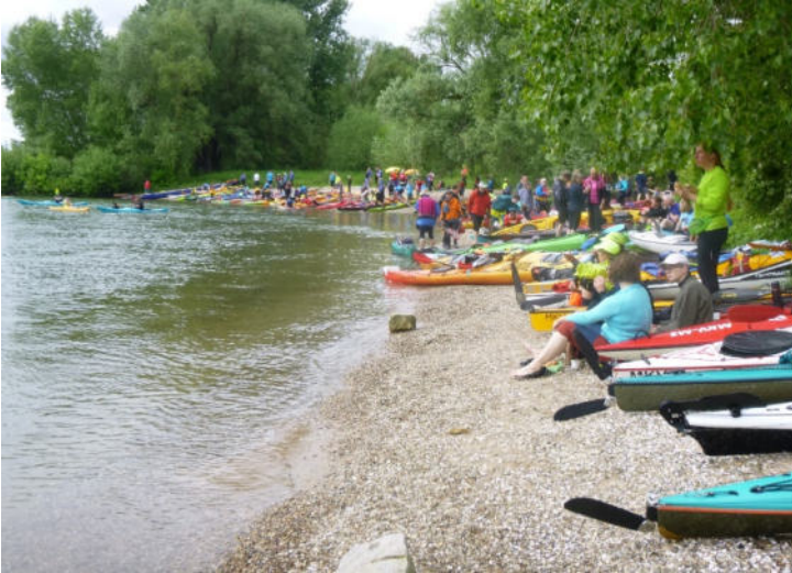
Zahlreiche Paddler an der Kontrollstelle bei Rheindürkheim

Schon ein paar Tage später war das nächste Paddelevent angesagt. Fünf Kanuten paddelten am Himmelfahrtstag von der Friesenheimer Insel (Mannheim) nach Worms. Bei schönem Sonnenschein und nur mäßigem Wind fuhren wir den Sandhofer Altrhein hinunter bis zur Mündung in den Rhein und dort weiter zur Petersaue.