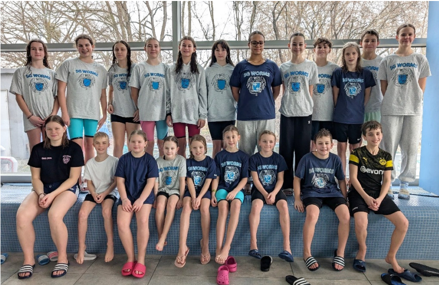
Eine stolze SG- Mannschaft in Ludwigshafen =====