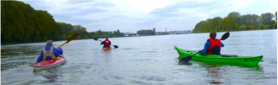
Unterwegs nach Worms

Wasser dümpeln, bei warmen Sonnenstrahlen, so lässt es sich gut aushalten.