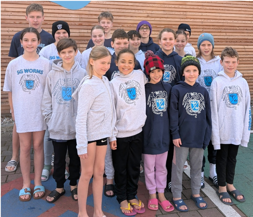
Unsere erfolgreiche SG-Mannschaft in Lampertheim