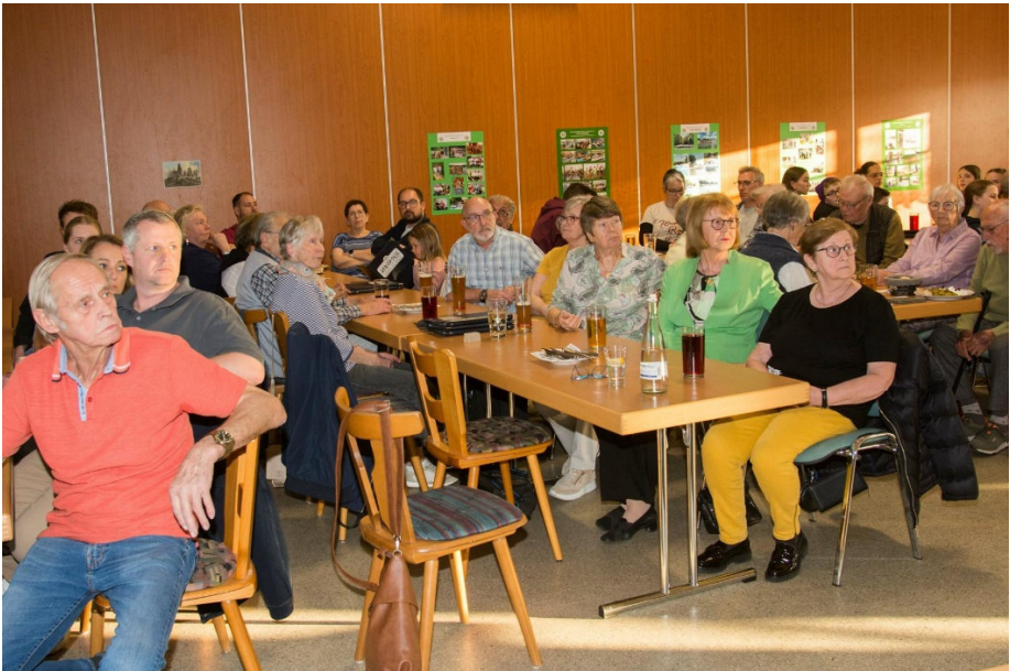
Zahlreich erschienen aufmerksame Vereinsmitglieder zur JHV 2025

Mit diesem Appell endete eine harmonische Jahreshauptversammlung im WSV-Vereinsheim.