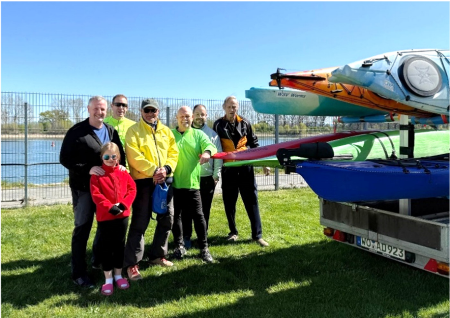
die WSV-Paddler auf dem Weg zum Startplatz

Im Frühjahr treffen sich Paddler aus den drei Vereinen - Kanuverein Worms, Faltbootclub Worms und Wassersportverein Worms - zum gemeinsamen Start in die Saison.