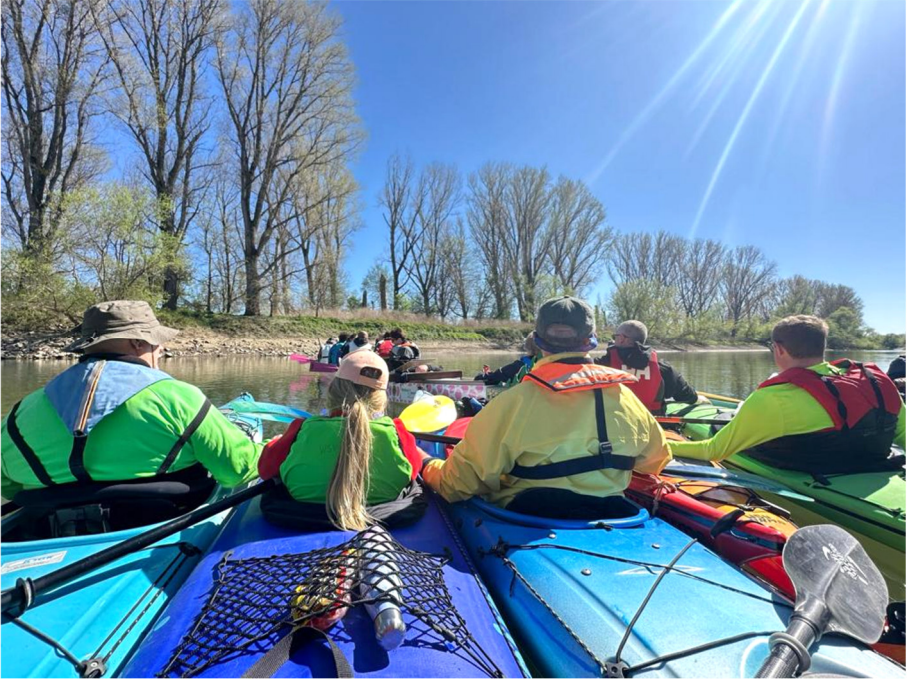
Trinkpause im Altrheinarm

Nach einem Drittel der Strecke wurde in einem Altrheinarm eine Trink- und Verpflegungspause eingelegt. Danach wurde nach Worms weiter gepaddelt.