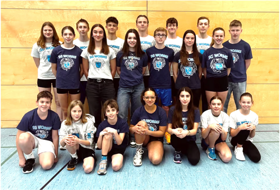
□ unsere erfolgreiche SG-Schwimm Mannschaft in Mainz