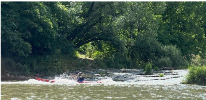
Altmühl - Bootsgasse

Einen besonderen Kick und Spaß hatten wir an den Bootsgassen an der Hammermühle und in Hagenacker. Mit kräftigem Schwung und etwas Spritzwasser ging es über die Wehranlagen nach unten. Ein wenig Wasser im Boot und nasse Kleider hatten wir als Zugabe.