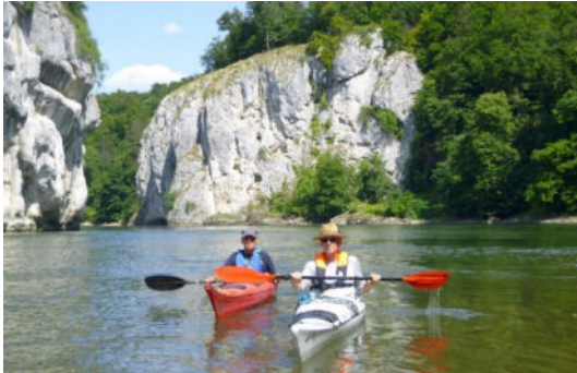
Donau - Weltenburger Enge

Die Donau, nicht allzu weit entfernt, wollten wir auch noch befahren. Bei Neustadt a.D. setzten wir unsere Boote ein. Mit flotter Strömung erreichten wir unseren ersten Pausenort bei Eining an der Fähre, danach war es nur noch ein kurzes Paddelstück bis zum Kloster Weltenburg. Dort stärkten wir uns mit frischem Dunkelbier und einer kleinen Vesper im Klostergarten.