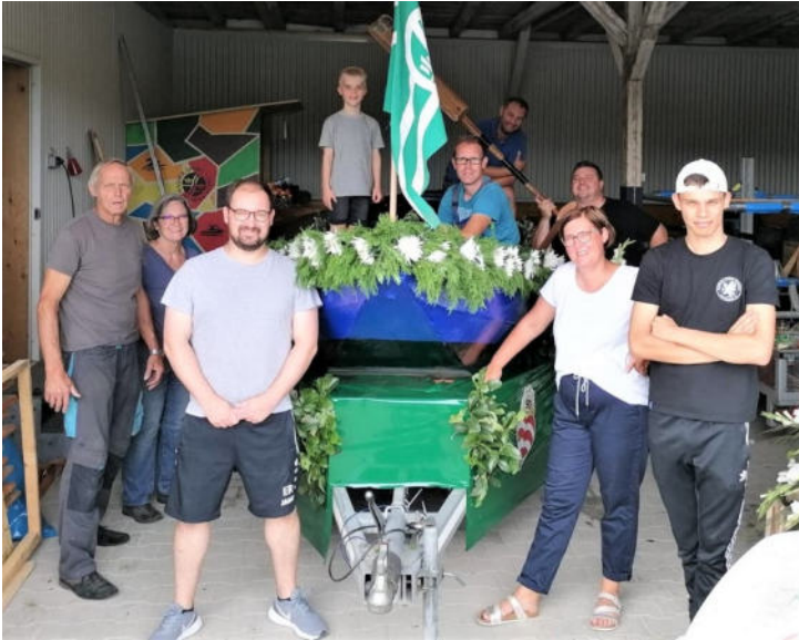
Es ist vollbracht - ein Teil unserer Handwerker*innen und Dekorateur*innen