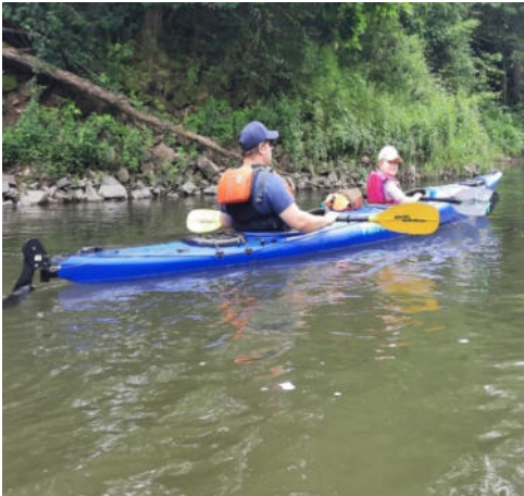
...mit den Kindern

10 Kanuten der Kanuwanderabteilung paddelten an einem Juniwochenende auf der Lahn. Basisstation der Exkursionen war das schön gelegene und gepflegte Vereinsgelände des Paddel Club Wißmar, wo wir mit einigen Wohnwagen und Zelten übernachteten. Am Freitagabend waren alle Beteiligten eingetroffen und beim gemeinsamen Grillen wurden die anstehenden Paddeltouren besprochen.