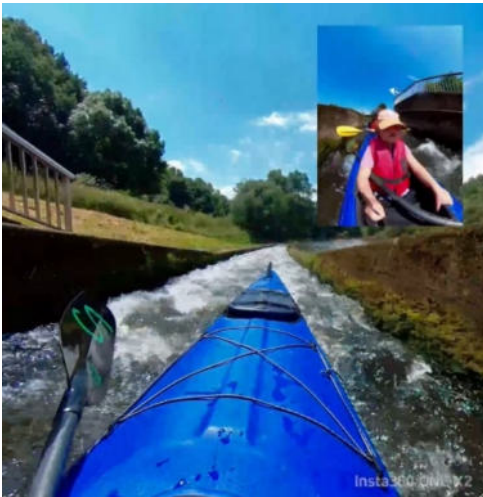
In der Bootsgasse

Für den nächsten Tag hatten wir uns eine kürzere Paddelstrecke ausgesucht. Von Odenhausen bis zum Paddelclub Wißmar waren es nur 7 km. Neben den üblichen kleineren Stromschnellen hielt uns nur ein weiteres Wehr mit Wasserkraftwerk bei der Gemeinde Lollar auf. Auch hier war eine Bootsgasse gebaut, aber mit einer Kurve, so dass wir die Boote nur hinuntertreideln konnten. Bald schon hatten wir wieder unser Basislager beim PC Wißmar erreicht.