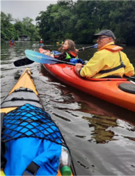
Paddeln auf der Lahn