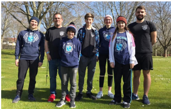
Unsere SG-Mannschaft in Mainz